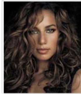
2006 Leona Lewis (24 ans)

Il travaille actuellement sur l'enregistrement de son 2 ème album.