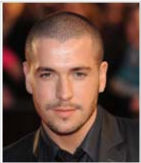
2005 Shayne Ward (25 ans)

6 millions d'exemplaires de son 1 er album , sorti en 2007, ont d'ores et déjà été vendus.