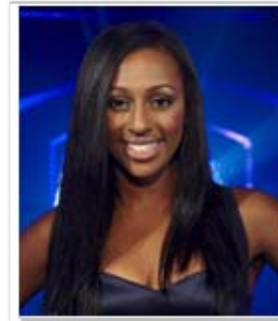
2008 Alexandra Burke (21 ans)

En 2007, il sort son 2 ème album qui fonctionne aussi bien que le 1 er en Angleterre, avec plus de 500 000 albums vendus !